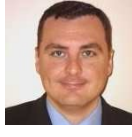
Gerardo Gavilanes Ginerés Subdirector General Ministerio de Fomento